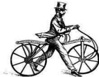
Figure 2: Image du vélocipède.

Il n'y a pas de pédales! On pousse et on freine avec les pieds. Quel est l'avantage? Si tu ne vois pas, l'inventeur a placé des indices dans le nom qu'il lui a donné: vélocipède. Découpe en deux parties: véloci et pède. Alors, as-tu trouvé la réponse?