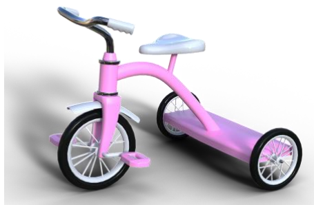
Figure 5: Le tricycle

Si on revient sur ton expérimentation de la grande roue, les pédales étaient directement sur la roue avant. Imagine-toi donc que même en ajoutant le système de chaîne et roues dentées, on a toujours un problème quand on arrête de pédaler. Sais-tu lequel? Rappelle-toi ton tricycle (Figure 5).