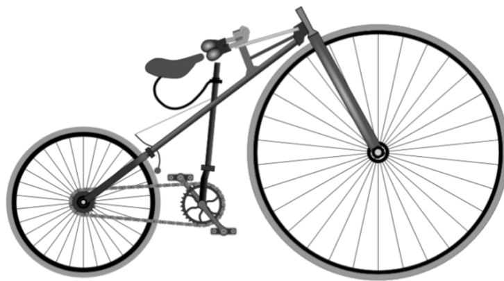
Bicyclette de Lawson

Si tu retournes aux images de l'histoire de l'évolution du vélo, en 1879 , on voit qu'on a conservé la grande roue, mais que constates-tu sur l'emplacement des pédales? (Figure 4)