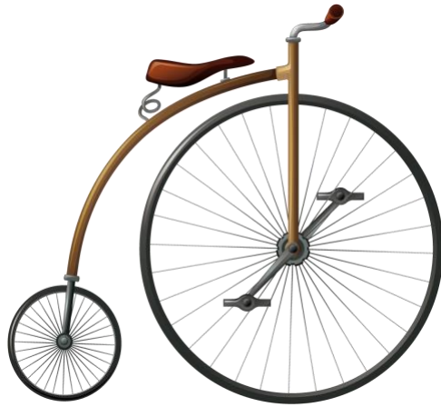
Figure 3: Le Grand-Bi